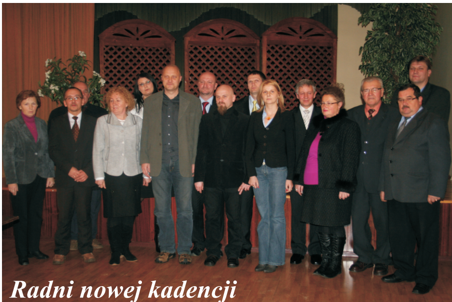
Radni nowej kadencji