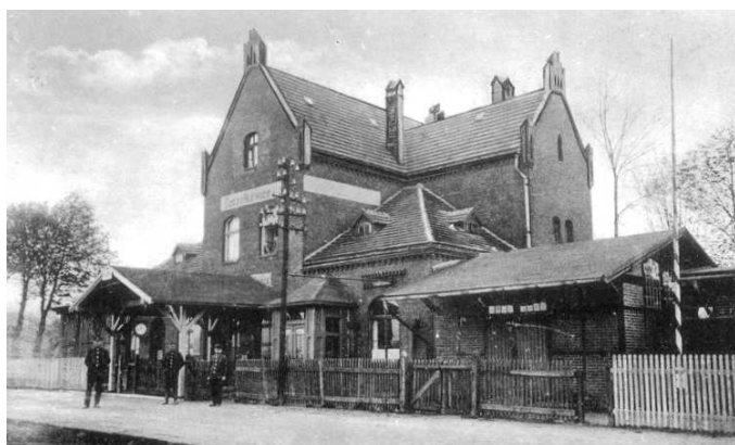
Dworzec Kolejowy na zdjęciu z końca XIX w.

jowego. Początkowy księgozbiór wynosił 865 tomów. W 1953 r. przeniesiono ją w mury nowej Szkoły Podstawowej przy ul. Powstańców Śląskich. Z czasem