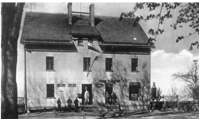
Sklep i Urząd Pocztowy W. Kokota na zdjęciu z lat '30-tych XX w.