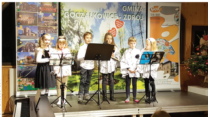
Występ zespołu "FLECIKI" z Powiatowego Ogniska Pracy Pozaszkolnej.