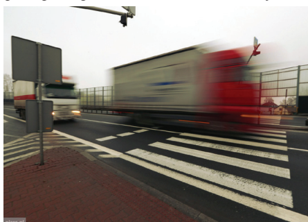
Obecne przejście dla pieszych na drodze DK1 łączącej ul. Borowinową z "Borkami".

Po wstępnych rozmowach, w grudniu 2017r. gmina wystąpiła pisemnie do Generalnej Dyrekcji Dróg Krajowych i Autostrad o wpisanie do Programu Likwidacji Miejsc Niebezpiecznych zadania inwestycyjnego mającego na celu poprawę bezpieczeństwa ruchu drogowego w gminie Goczałkowice-Zdrój. Kon-