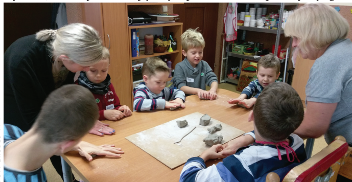
FOT. ŹRÓDŁO PP1

Publicznego Przedszkola nr1 w Goczałkowicach-Zdroju