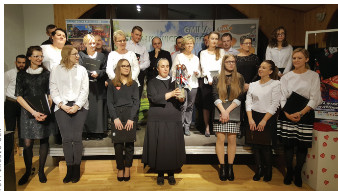
Goczałkowicki chór parafialny SEMPER COMMUNIO.