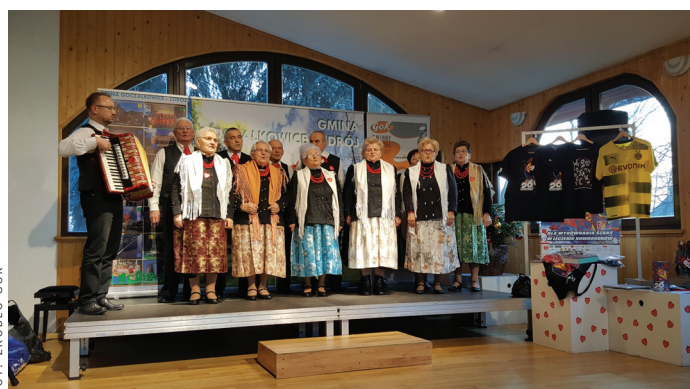
Koncert Zespołu Folklorystycznego Goczałkowice.