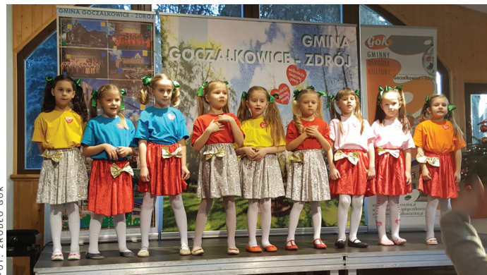
Występ dzieci uczęszczających na warsztaty taneczne GOK-u.