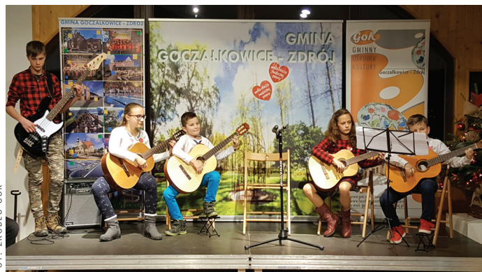
Prezentacja uczestników warsztatów muzycznych GOK-u.