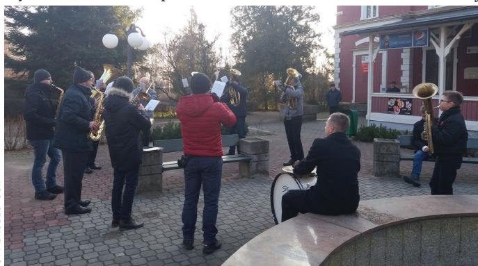
Koncert Goczałkowickiej Orkiestry Dętej w Uzdrawisku.