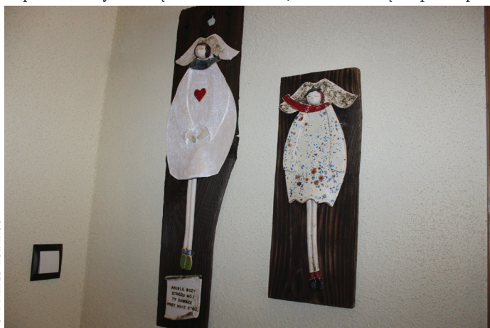
Wyjątkowe anioły, które ozdabiają jej przedpokój.

taty ceramiczne. Ale nie poszła, bo jest samoukiem. Czytała książki o pracy z gliną, szukała informacji w internecie.