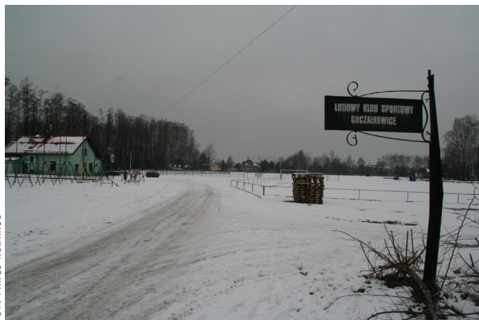
Obiekty przy ul. Uzdrowskiej 44 zostaną zmodernizowane.