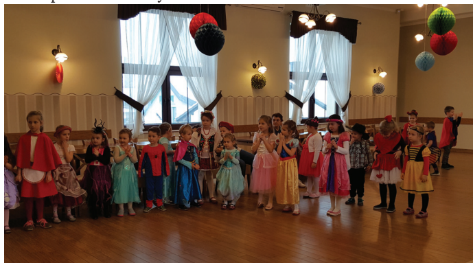
Karnawałowy bal przebierańców dla najmłodszych dzieci.