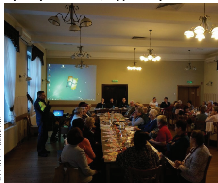
FOT. - KPP PSZCZYNA