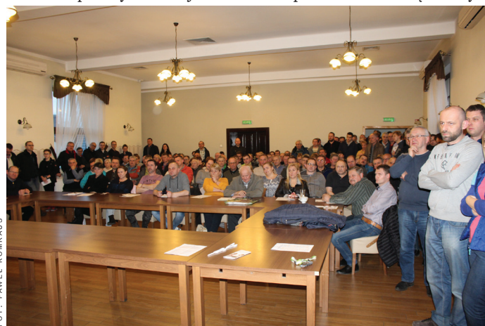
Spotkanie na temat walki ze smogiem cieszyło się ogromnym zainteresowaniem.