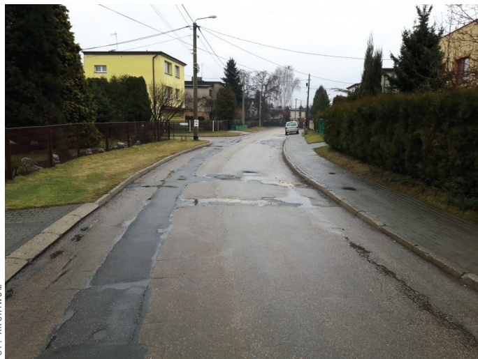
Fragment ul. Żeromskiego przeznaczony do przebudowy.

gości 70,94 m i długości 70,33 m. - przebudowę ul. Korfantego