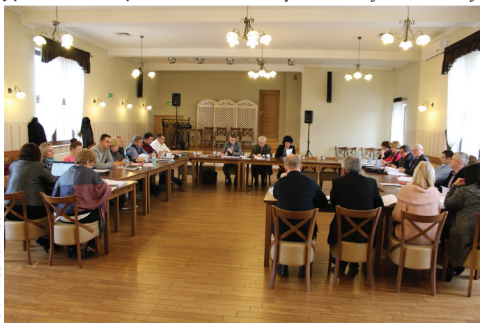
Podczas sesji Rady Gminy, która odbyła się 20 marca.