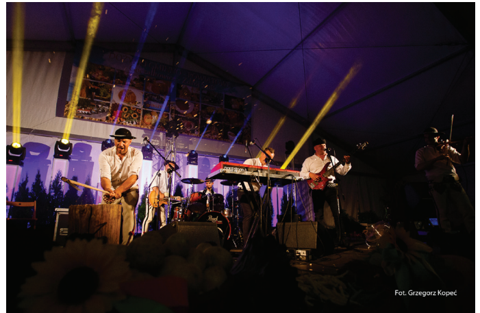
Wieczorny koncert zespołu BACIARY przyciągnął rzesze fanów.