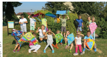
FOT. SP 1

Dziękujemy rodzicom za trud włożony w pomoc przy wykonaniu latawców. Zapraszamy do wspólnej zabawy w przyszłym roku.