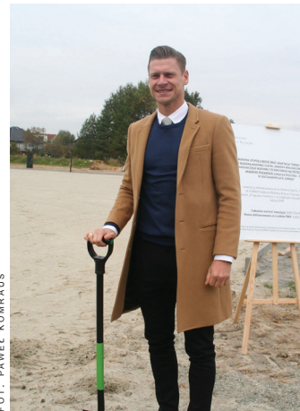
Pomysłodawca projektu – Ł. Piszczek.