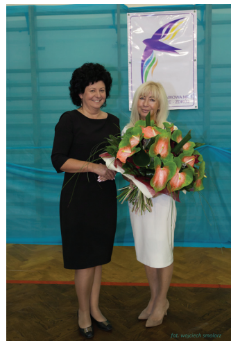
Wójt Gminy z zaproszonym gościem.

Konferencja z sędzią Anną Marią Wesołowską z pewnością zainteresowała swoją tematyką wszystkich uczestników spotkań, zarówno tych starszych jak i młodszycy czego potwierdzeniem były