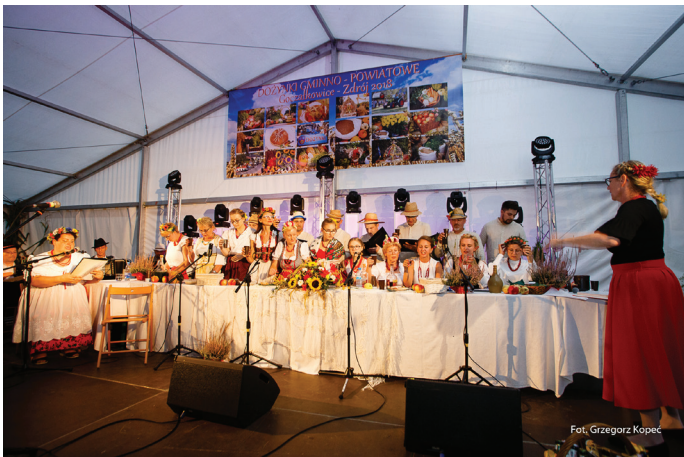
Dożynkowa biesiada z chórem parafialnym Semper Communio.