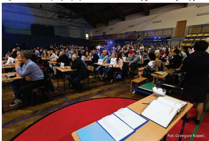
W zabawie wzięło udział kilkadziesiąt drużyn.