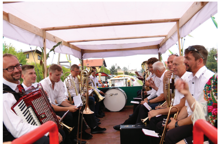
O oprawę artystyczną uroczystości zadbała również Goczałkowska Orkiestra Dęta.