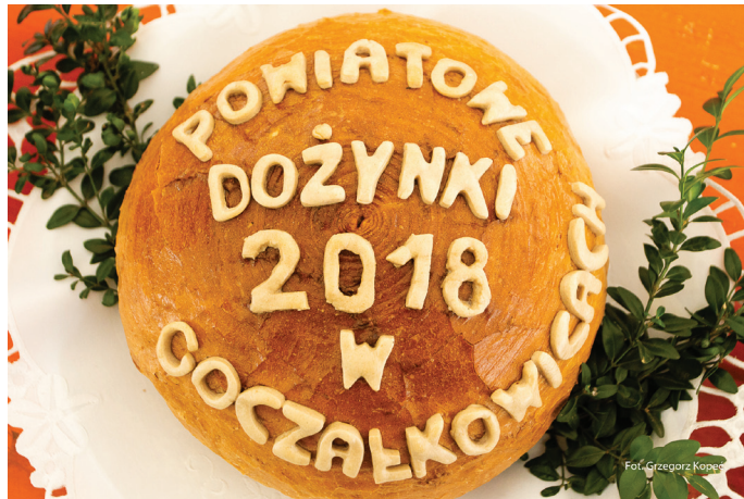
Każdą uroczystość dożynkową rozpoczyna wręczenie obrzędowego chleba.

Uroczystości rozpoczęły się od mszy św. w kościele św. Jerzego. Po jej zakończeniu niezwykle barwny korowód przejechał ulicami gminy, podziwiany przez mieszkańców i turystów. Lokalni rolnicy prezentowali w nim dawne tradycje oraz nowoczesne, imponujące maszyny. Trasa korowodu, jak i całe Goczałkowice zostały