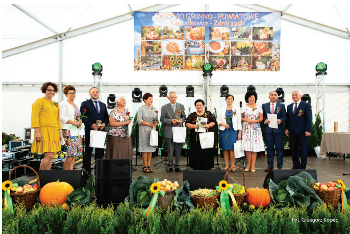
Rolnicy wyróżnieni nagrodą Starosty Pszczyńskiego ŻUBRY PSZCZYŃSKIE.