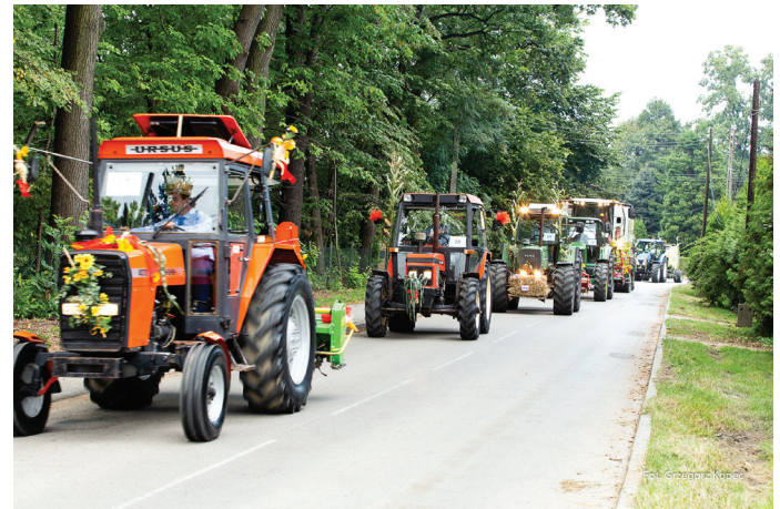
Przejazd barwnie przystrojonego korowodu ulicami Goczałkowic.

pięknie udekorowane przez mieszkańców, za co należą im się wielkie brawa!