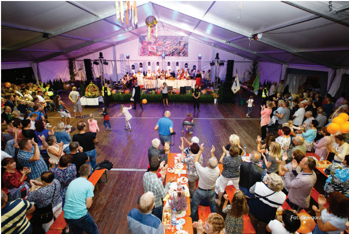
Na dożynkach bawiło się wielu mieszkańców Goczałkowic i okolicznych gmin.