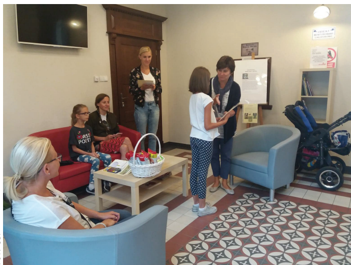
Nagrody w wakacyjnych konkursach GBP wręczono w siedzibie Starego Dworca.