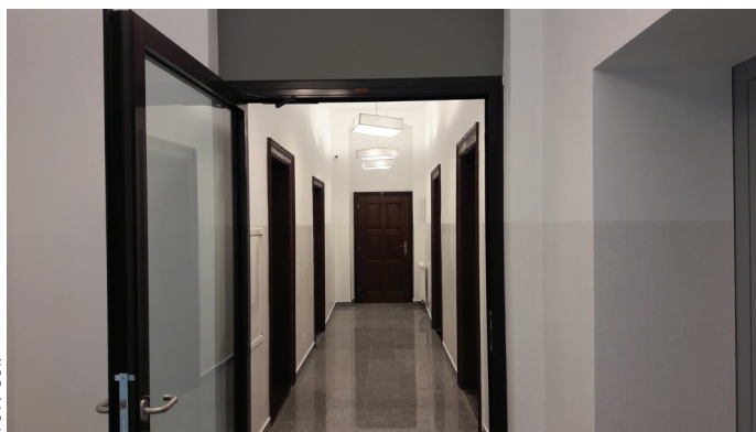
Korytarz na I piętrze, siedziba Gminnego Ośrodka Kultury,