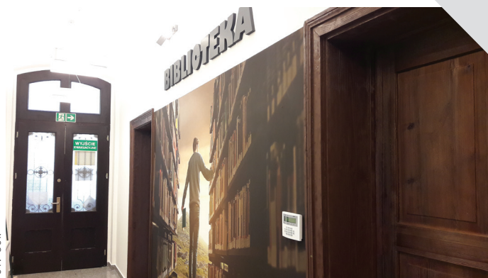
Parter budynku, wejście do Gminnej Biblioteki Publicznej.

Jednym z ważniejszych etapów inwestycji był montaż windy, dzięki któremu obiekt stał się przy-