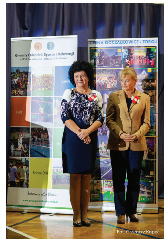
Wójt Gminy wraz z Dyrektorem SP 1.