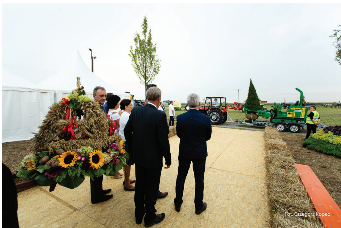
Wniesienie Korony Dożynkowej na miejsce uroczystości obrzędowych.

W uroczystym świętowaniu udział wzięli przedstawiciele samorządów i instytucji w powiecie pszczyńskim, działacze społeczni, rolnicy, licznie zgromadzeni mieszkańcy oraz kuracjusze. Podczas dożynek wręczono wyróżnienia starosty pszczyńskiego – Żubry