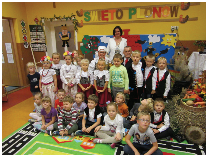
FOT. PP NR2

Jako pierwsze wystąpiły dzieci z grupy „Sowy”, które przebrane w stroje nawiązujące do folkloru recytowały wiersze i wniosły do sali chleb, a następnie przekazały go na ręce pani