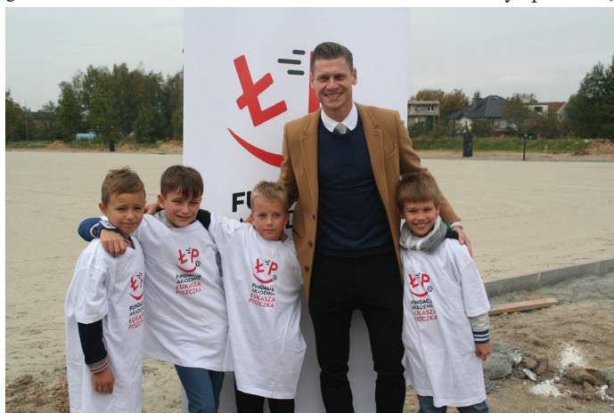
Już za kilka miesięcy rozpocznie się nabór do kadry małych zawodników.