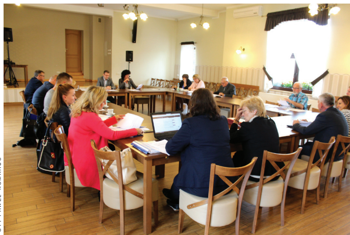
Podczas sesji Rady Gminy, która odbyła się 2 października.

Radni na październikowej sesji wyrazili zgodę na zawarcie porozumienia w sprawie powierzenia wykonania zadania polegającego na opracowaniu operatu uzdrowiskowego w 2018 r. Chodzi o porozumienie z gminą Strumień, bo strefa „C” ochrony uzdrowiskowej obejmuje także sołectwo Zabłocie – Solanka w tej gminie. Na wykonanie operatu Strumień przeznaczony 25 tys. zł.