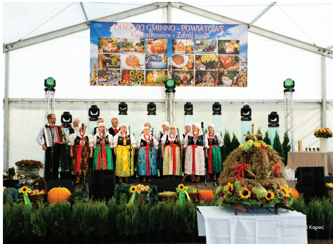
Na Dożynkach nie mogło zabraknąć ludowego akcentu. Na zdj. występ Zespołu Folklorystycznego Goczałkowice.

Dożynki to podziękowanie, organizatorzy zadbali o to, by był to też czas zabawy. Można było przejechać się melexem i ciuchcią ulicami Goczałkowic, podziwiać wystawę sprzętu rolniczego, stoiska producenckie, zagrodę zwierząt hodowlanych, dla dzieci przygotowano dmuchańce. Po części oficjalnej nadszedł czas na radość i dobrą muzykę. Na scenie odbyła się biesiada z chórem Semper Communio i muzykami zespołu Art Music Trio. Wieczorem tłumy mieszkańców bawiły się z zespołem