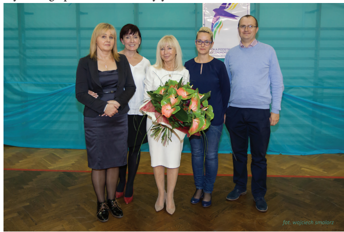
Organizatorem wydarzenia był Ośrodek Pomocy Społecznej.