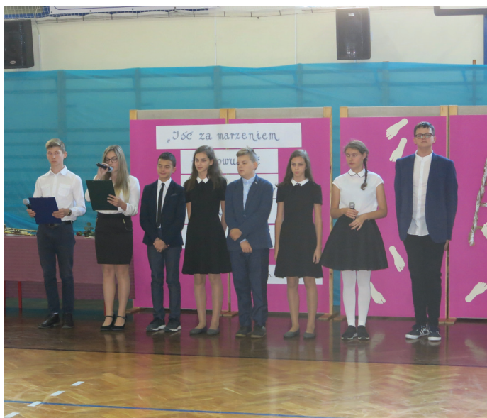
Akademii przygotowali uczniowie SP1.