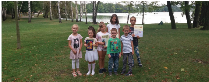
Wyróżnione zdjęcia: "Czytanie nad jeziorem" i "Morskie czytanie".