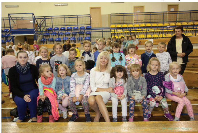
W spotkaniu wzięły również udział goczałkowickie przedszkolaki.