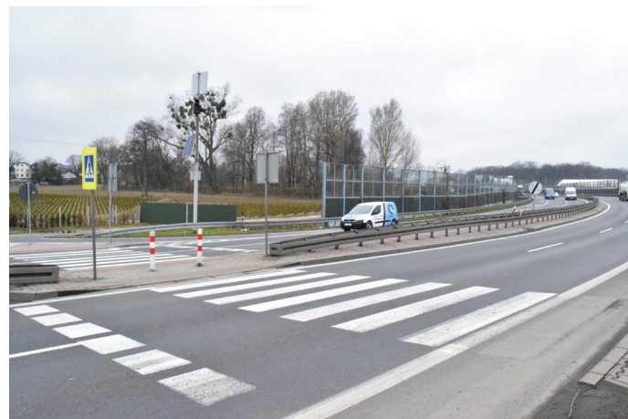
Jeszcze w tym roku to przejście dla pieszych przez DK 1 zostanie zlikwidowane