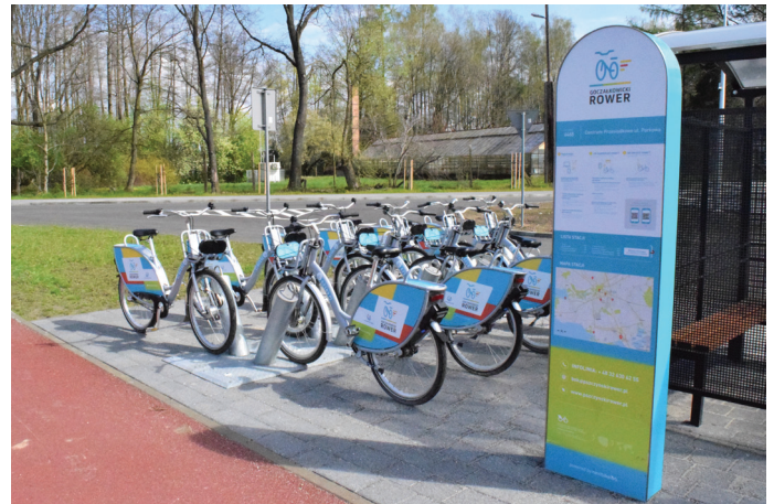
Jedną z dwóch stacji w Goczałkowicach znajduje się na centrum przesiadkowym przy ul. Parkowej

– Po udanej rejestracji Klient otrzymuje wygenerowany automatycznie PIN, który wraz z numerem telefonu służy logowaniu się