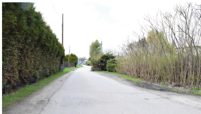
UG Rozbudowa będzie kosztować prawie milion zł

Inwestycja będzie realizowana w ramach drugiego etapu budowy centrum przesiadkowego. Termin wykonania prac mija końcem sierpnia.