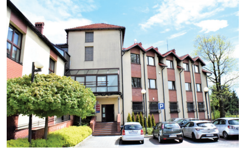
Punkt będzie dostępny w Urzędzie Gminy

Program „Czyste powietrze” jest skierowany do właścicieli lub współwłaścicieli jednorodzinnych budynków mieszkalnych, lub wydzielonych w budynkach jednorodzinnych lokali mieszkalnych z wyodrębnioną księgą wieczystą. Można pozyskać dofinansowanie do wymiany starych i nieefektywnych źródeł ciepła na paliwo stałe na nowoczesne źródła ciepła spełniające najwyższe normy oraz przeprowadzenia niezbędnych prac termomodernizacyjnych budynku. Dotacja może wynosić do 30 tys. zł dla podstawowego poziomu dofinansowania i 37 tys. zł dla podwyższonego poziomu dofinansowania.