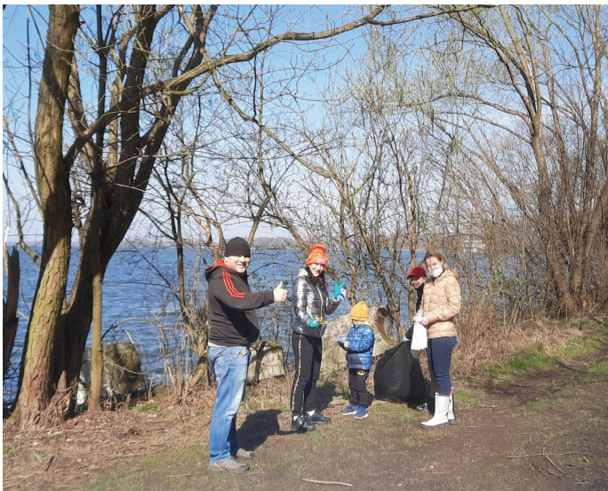
W akcję zaangażowały się często całe rodziny