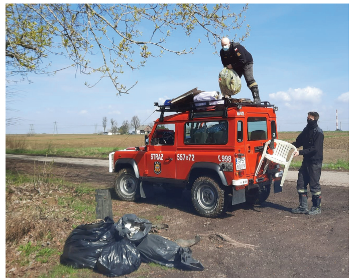
Było co zbierać