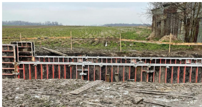
Zbiornik będzie miał ok. 15 tys. m 3 pojemności

Prace na zlecenie Urzędu Gminy Goczałkowice-Zdrój wykonuje firma Brigadon z Jaworzna. Ich koszt to 2 mln 113 tys. 500 zł. Lokalizacja zbiornika została wskazana na podstawie