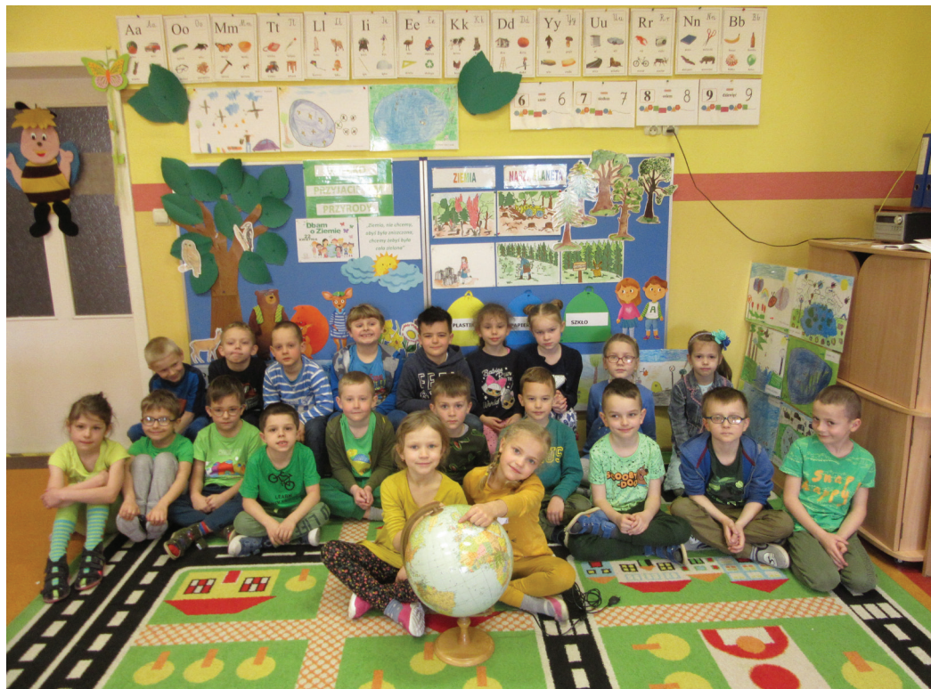
Dzieci wiedzą, że od nas zależy, jak będzie wyglądała nasza planeta

W środę, 21 kwietnia w Publicznym Przedszkolu nr 2 szczególnie zastanawiano się, jak chronić nasz wspólny dom – Ziemię, jak pomóc naszej planecie, aby ten wspólny dom stał się czysty, zdrowy i piękny. Tegoroczne obchody odbyły się pod hasłem „Ziemię, Nie chcemy, abyś była zniszczona, chcemy żebyś była cała zielona”. W tym