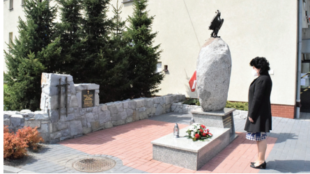
Punkt będzie dostępny w Urzędzie Gminy

Przy ul. Szkolnej w Goczałkowicach-Zdroju, w pobliżu Publicznego Przed-