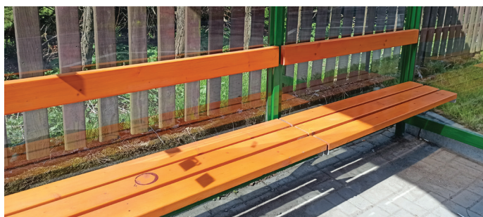
Posprzątano siedem przystanków w gminie