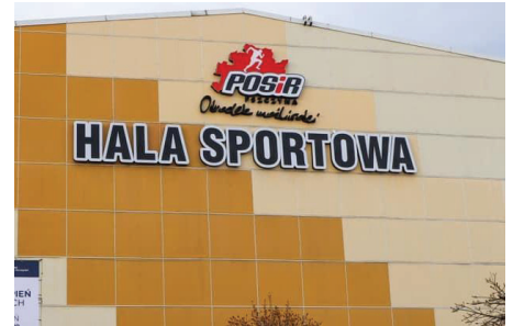
Punkt znajduje się przy ul. Zamenhofska 5a w Pszczynie

Jeśli chcesz się zarejestrować za pośrednictwem infolinii 989, możesz to zrobić sam/a lub może Cię zapisać ktoś bliższy z rodziny. Do zapisu wystarczy numer