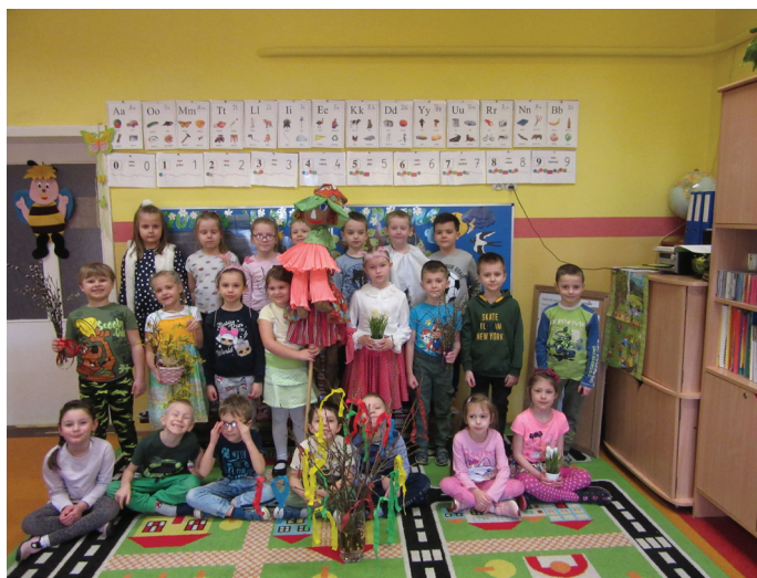
Dzieci godnie powitały wiosnę

22 marca wszystkie przedszkolaki z Publicznego Przedszkola nr 2 zebrały się i witały wiosnę w pięknie udekorowanych wiosennymi akcesoriami i elementami salach. Podczas zajęć poznały zwyczaje związane z nadejściem wiosny – robienie i topienie Marzanny – symbol odchodzącej zimy, chodzenie z Gaikiem – Maikiem – symbolem budzącej się do życia przyrody. Wysłuchały treści „Listu od Wiosny”. Odnajdywały w różnych miejscach sali znaki pozostawione przez Panią Wiosnę.