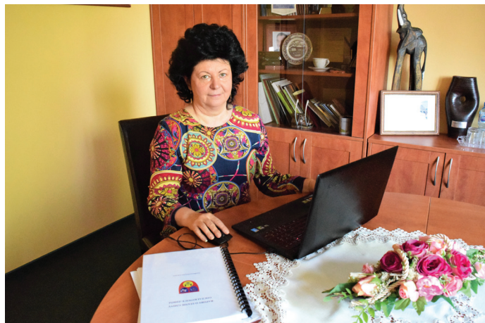
Wszyscy obecni na sesji radni opowiedzieli się za udzieleniem wójtowi absolutorium i wotum zaufania. Sesja odbyła się zdalnie.

W 2020 r. na inwestycje przeznaczono 8 mln 618 tys. 495 zł, co stanowi ponad 16% wszystkich wydatków! Udało się zrealizować szereg dużych, ważnych zadań. Powstał tak wyciekowany łącznik ulic Borowinowej i Zielonej wraz z parkingiem na 54 miejsca. Zakończyła się budowa centrum przesiadkowego, dzięki czemu przy ul. Parkowej powstały parkingi, zatoki dla busów, dojście na perony oraz droga dojazdowa z chodnikiem i drogą rowerową. Prace związane z modernizacją gospodarki energią przeprowadzono w Gminnym Ośrodku Sportu i Rekreacji, w 2020 r. rozpoczęła się także budowa nowego przedszkola. Zlecono sporządzenie dokumentacji projektowych kolejnych zadań (łącznik Źródłana-Spokojna, droga do ronda wzdłuż ekranów DK 1 oraz przedłużenie ul. Robotniczej do ronda, ul. Powstańców Śląskich z mostem, regulacją pasa drogowego i podziakami, droga rowerowa przez Bór II wzdłuż Kanaru oraz groblą do Wisły, parking przy ul. Zielonej i Uzdrowiskowej, nowy plac zabaw). Kontynuowano także prace na rzecz poprawy jakości powietrza – w ramach Programu Ograniczenia Niskiej Emisji wykonano 140 inwestycji ekologicznych. Jednocześnie kontynuowano pomoc dla Szpitala Powiatowego w Pszczynie, przekazując dotacje w wysokości 200 tys. zł. Zadłużenie na koniec 2020 roku z tytułu zaciągniętych pożyczek i kredytów wynosiło 3 mln 685 tys. 463 zł.