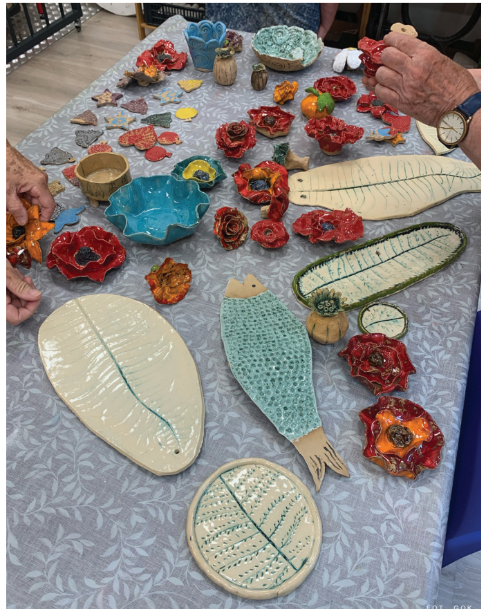
Podopieczni Klubu Seniora w ramach zajęć ćwiczą swoje umiejętności ceramiczne.