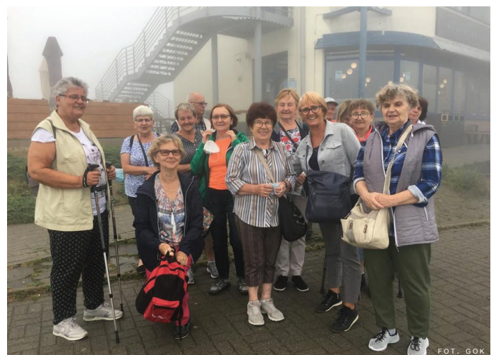
Seniorów na górę Żar powitała mglistą pogodą.