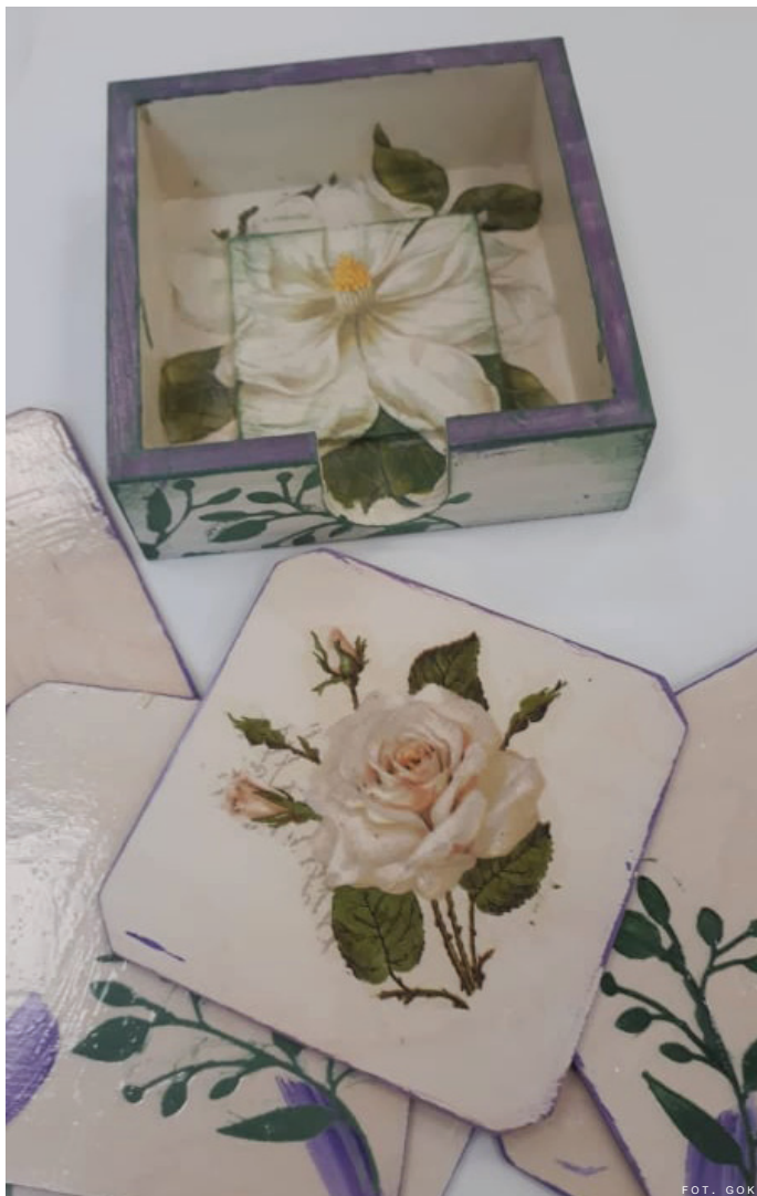
W pracowni artystycznej powstają m.in. przedmioty wykonane metodą decoupage.