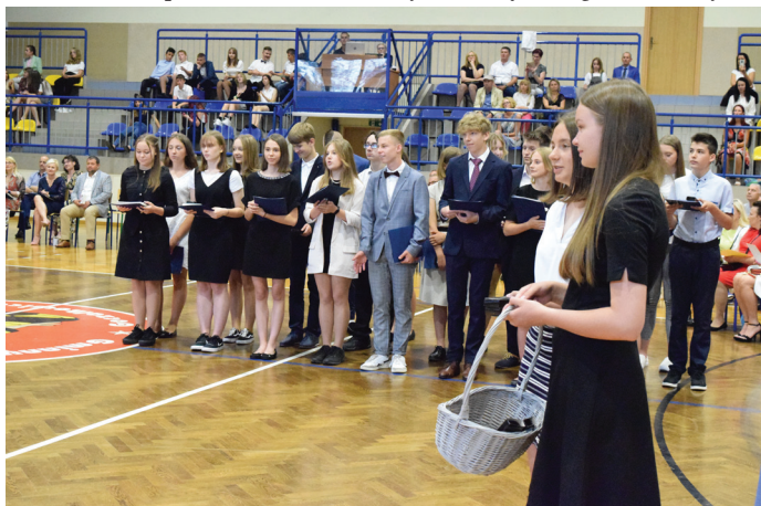
Podczas akademii absolwenci otrzymali świadectwa ukończenia szkoły