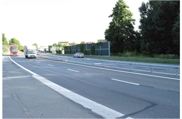
Z ul. Uzdrowskiej nie można wjechać na DK 1 w kierunku Katowic, jadąc DK 1 z Bielska nie można wjechać na ul. Uzdrowską

Kiedy tylko pojawił się pomysł wprowadzenia ograniczenia na tym skrzyżowaniu zwracano uwagę, że spowoduje to zwiększenie ruchu na drogach lokalnych, w tym tak często zakorkowanej ul. Głównej. Wójt gminy wielokrotnie występował w tej kwestii do GDDKiA, za każdym razem podkreślając konieczność wprowadzenia rozwiązań, które pozwoliłyby na poprawę bezpieczeństwa i uniknięcie chaosu komunikacyjnego na terenie miejscowości. Wśród propozycji były m.in. budowa prawoskrętu z DK 1 w ul. Głównej czy w ul. Brzozowej, budowa kładki dla pieszych i rowerzystów nad drogą w okolicy komisów samochodowych, a także przebudowa skrzyżowania i budowa sygnalizacji świetlnej w rejonie ul. Stawowej. Gmina oferowała też pomoc i partycypację w kosztach tych przedsięwzięć. W związku z tym, że przyczyną większości wypadków na „jedynce” jest nadmierna prędkość, proponowano wprowadzenie odcinkowego pomiaru prędkości. W odpowiedzi za każdym razem GDDKiA wskazywała