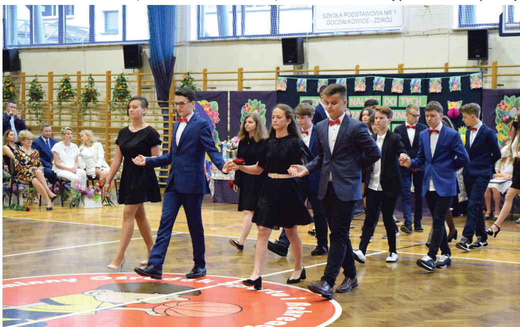
Uczniowie przygotowali ciekawy program artystyczny, tańczyli m.in. poloneza

Absolwenci podziękowali swoim nauczycielom, przygotowali także wyjątkowy program artystyczny, prezentując się do utworu „Dziwny jest ten świat”, tańcząc poloneza, a także słynną „belgijkę”, zapraszając do zabawy swoich nauczycieli.