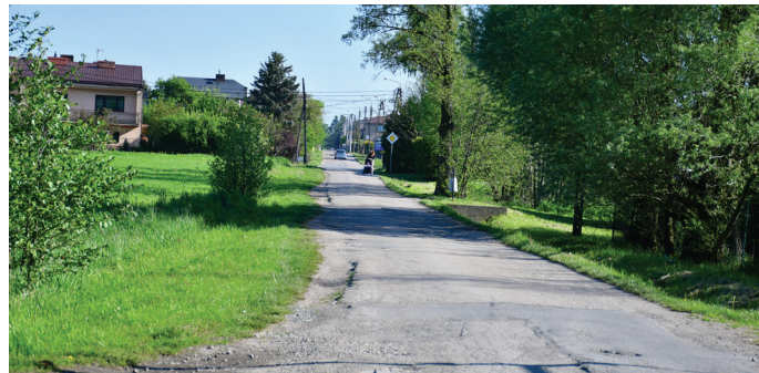
Ul. Powstańców Śląskich zostanie rozbudowana na odcinku od skrzyżowania z ul. Szkolną do ul. Bór II

Przypominamy, że na terenie gminy realizowane są dwa inne duże zadania. Nowa droga powstaje na Kolonii Brzozowej – chodzi o łącznik ulic Źródlanej i Spokojnej. Zakres obejmuje budowę drogi o szerokości 5,5 mb na długości ponad 900 mb wraz z drogą rowerową, wykonanie odwodnienia oraz budowę oświetlenia. Wartość inwestycji to 5 mln 75 tys. zł. Na jej realizację gmina Goczałkowice-Zdrój pozyskała dofinansowanie w wysokości 4 mln 503 tys. 982 zł z Rządowego Funduszu Polski Ład: Program Inwestycji Strategicznych – Polskie Uzdrawiska. Program skierowany był do gmin uzdrowiskowych oraz gmin posiadających status uzdrowiska.