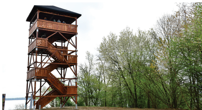
Wieża znajduje się w Wiśle Małej, przy brzegu Jeziora Goczałkowickiego (Fot. UG)