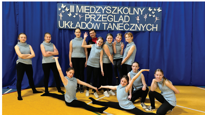
Brawa dla koła tanecznego!

Taniec to najpopularniejsza, ale też najlepsza forma ruchu, która pozytywnie wpływa na