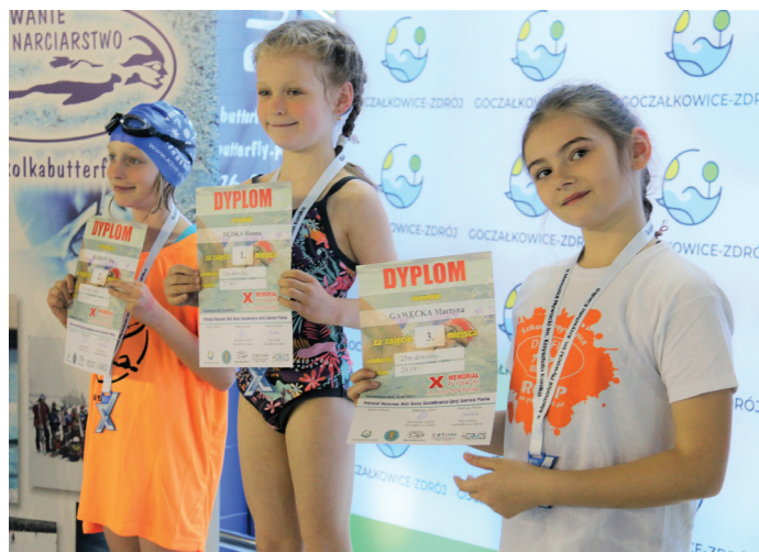
Najlepsi w swoich kategoriach otrzymali medale i dyplomy

Zawody zostały zorganizowane przez Gminny Ośrodek