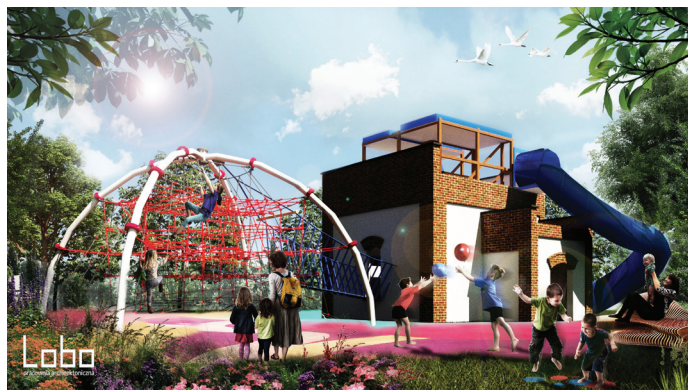
Wizualizacja placu zabaw, który ma powstać na Kolonii Brzoszowej (Wiz. UG)

Procedura planistyczna jest skomplikowana i czasochłonna. Gmina robi jednak wszystko, aby została ona przeprowadzona sprawnie, żeby można było jak najszybciej przystąpić do uzyskiwania niezbędnych pozwoleń na prace budowlane. Zgodnie z przepisami, samorząd wystąpił do prawie 40 instytucji z zawiadomieniem o przystąpieniu do sporządzenia MPZP. W pierwszej połowie maja podpisano umowę z wykonawcą planu.