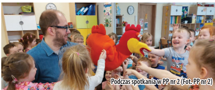
Podczas spotkania w PP nr 2