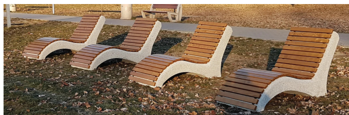
Podobne leżaki już wkrótce będą dostępne przy Maćku Małym