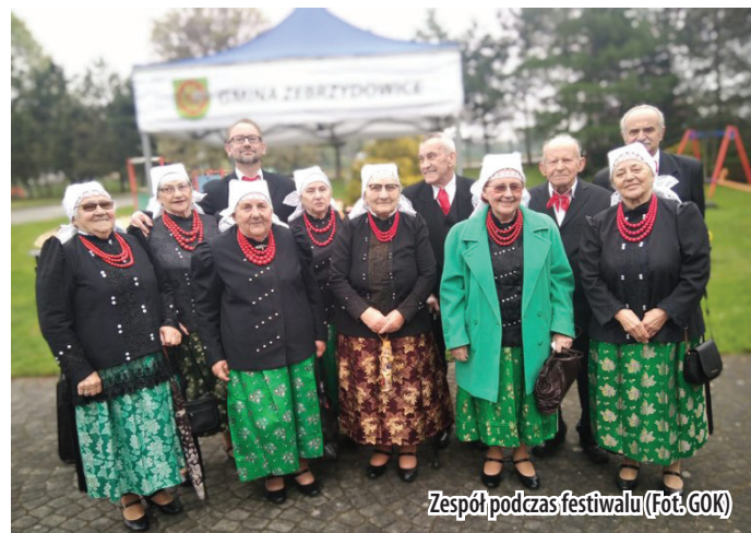
Zespół podczas festiwalu