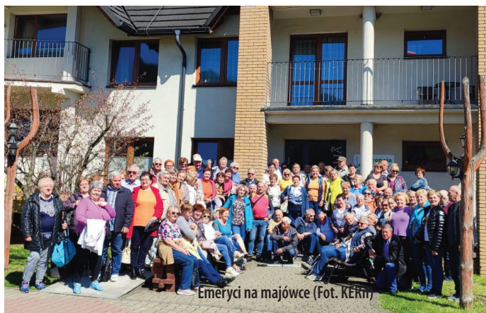
Emerycy na majówce

4 maja Zarząd Koła Emerytów Rencistów i Inwalidów w Goczałkowicach-Zdroju dla 91 członków Koła zorganizował wyjazd rekreacyjno-biesiadny do miejscowości Węgierska Górka. Ośrodek Wczasowy „Azalia” był znakomitym miejscem, w którym nasi goście mogli się zrelaksować oraz posmakować regionalnych potraw. Ponadto, odpowiednio dobrana oprawa muzyczna DJ była okazją do zabawy miłośników tańca. Sympatykom spacerów dopisała piękna słoneczna pogoda, a wraz z nią podziwianie widoków gór Beskidu Żywieckiego. Podsumowując, Majówka odbyła się w miłej atmosferze. Małgorzata Paszek