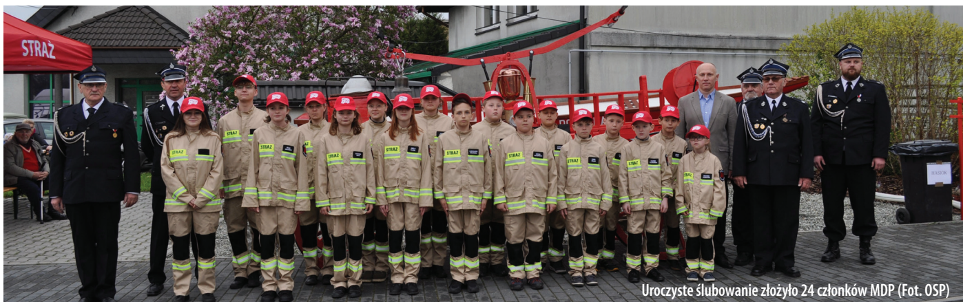
Uroczyste ślubowanie złożyło 24 członków MDP