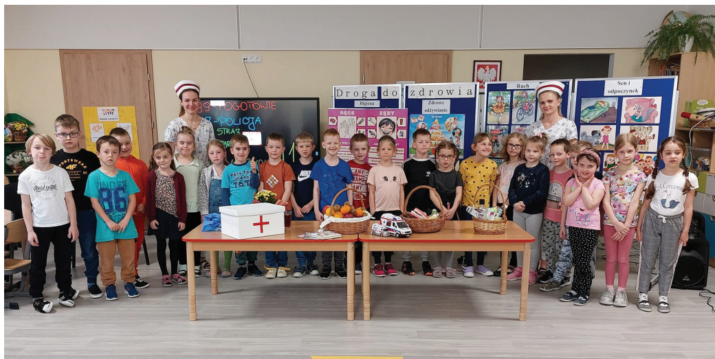
To było bardzo pouczające spotkanie (Fot. PP nr 2)

Kolejnym punktem spotkania było zademonstrowanie przez panią Olę ilustracji zaniedbanego chłopca – Stasia, który nie stosował zasad higieny. Na pytanie, czy chciałyby mieć takiego przyjaciela, jednogłośnie odpowiedziały „nie”. Był to dobry moment do rozmowy z pod-