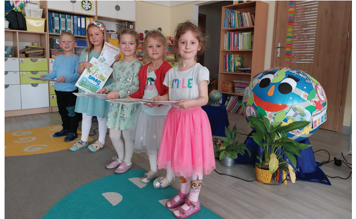
Dzieci wspaniale przygotowały się na konkurs recytatorski (Fot. PP nr 2)

święta odbył się także Konkurs Recytatorski, na który zgłosiło się tak wielu chętnych, że trzeba było przeprowadzić eliminacje wstępne. Odbywały się one w grupie Sów od wtorku. Wszyscy przygotowali utwory zgodne z tematem, tzn. z przyrodą, ochroną planety, Dniem Ziemi. Trzeba przyznać, że organizatorzy byli pod wielkim wrażeniem stopnia trudności wybranych wierszy. Dotarły do nas również wierszyki wymyślone właśnie z tej okazji. Wszystkim ogromnie gratulujemy i bijemy wielkie brawa. Rodzicom dziękujemy za poświęcony dzieciom czas, przygotowanie swoich pociech, czym przyczynili się do pomocy w zorganizowaniu tego wyjątkowego dnia. Ponieważ wszyscy przygotowali się z taką starannością, deklamowali wiersze, przygotowali rekwizyty, nie można było wyłonić zwycięzców, kolejnych