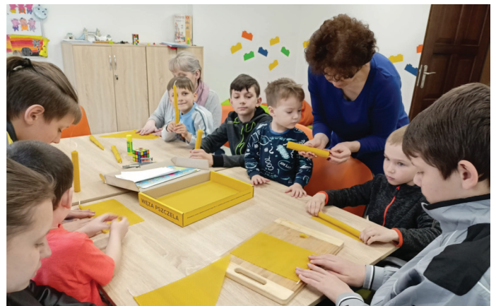
Mogą także wziąć udział w zajęciach artystycznych