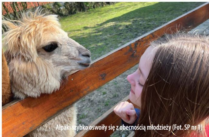
Alpaki szybko oswoiły się z obecnością młodzieży