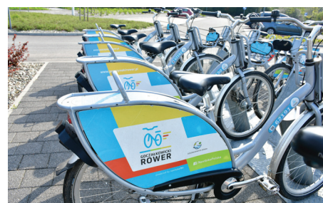
System będzie dostępny do końca października