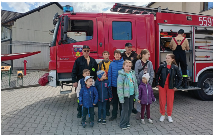
Uczestnicy projektu spotykają się ze strażakami z OSP Goczałkowice-Zdrój