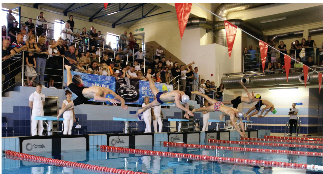
W zawodach udział wzięło ok. 250 pływaków