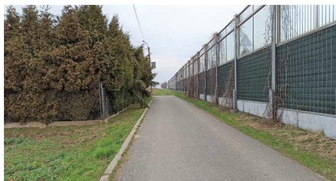
Wzdłuż DK 1 wybudowana zostanie nowa droga, do ronda w rejonie zakładów mięsnych

Trwa termomodernizacja budynku Urzędu Gminy. Prace polegają na ociepleniu ścian i dachu, wymianie stolarki okiennej i drzwiowej, montażu nowych kotłów gazowych. Wymieniono już oświetlenie wewnętrzne na ledowe.