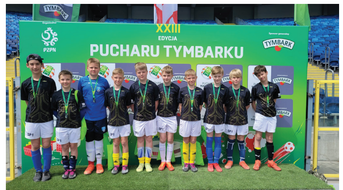
Brawa dla naszych piłkarzy