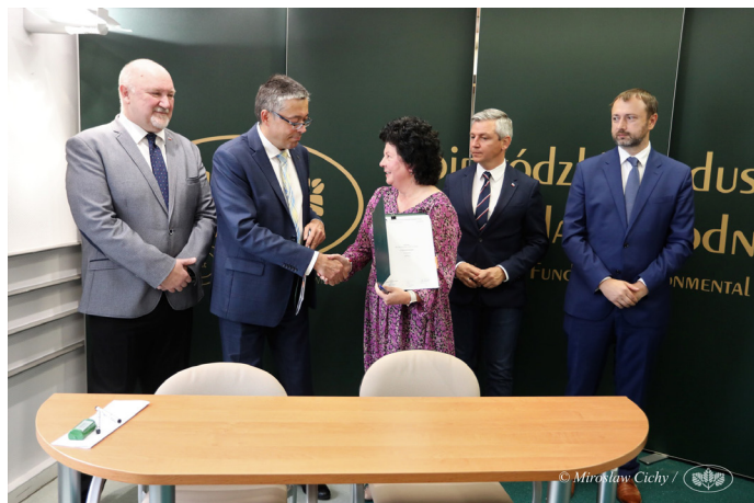
Umowa została podpisana 11 sierpnia