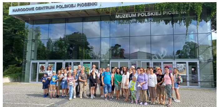
Stolica Górnego Śląska oraz góra św. Anny to kolejny z wakacyjnych kierunków