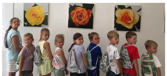
Na śródowych zajęciach dzieci uczestniczyły m.in. w warsztatach szycia