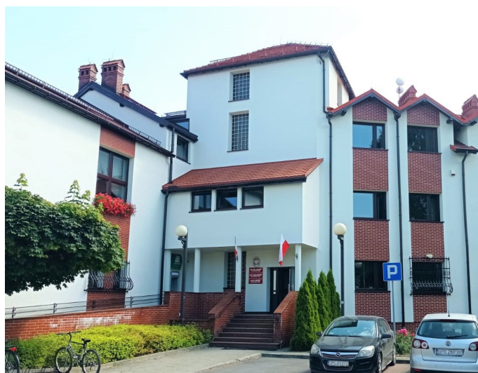
UG ▲ Budynek urzędu po przeprowadzonych pracach (Fot. UG)

Całkowity koszt inwestycji to prawie 1,3 mln zł. Na jej realizację Gmina Goczałkowice-Zdrój pozyskała 890 tys. zł z Narodowego Funduszu Ochrony Środowiska i Gospodarki Wodnej w ramach programu „Klimatyczne uzdrowiska”.