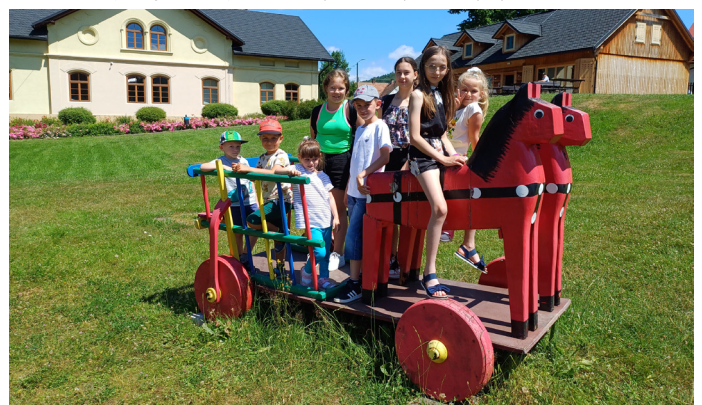
Muzeum Zabawki Drewnianej w Stryszawie prezentuje wyjątkowe eksponaty