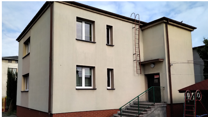
UG ▲ Na sprzedaż wystawiono budynki po byłym przedszkolu nr 2 (Fot. UG)

Cena wywoławcza wynosi 600 tys. zł brutto. Przetarg odbędzie się 21 września 2023 r. w sali nr 101 Urzędu Gminy Goczałkowice-Zdrój przy ul. Szkolnej 13, o godzinie 10.00. Więcej informacji można znaleźć w Biuletynie Informacji Publicznej Urzędu Gminy Goczałkowice-Zdrój i na stronie internetowej Urzędu Gminy goczalkowicezdroj.pl .