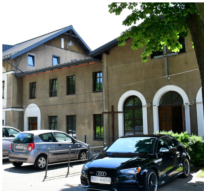
Dofinansowanie wyniesie prawie 1 mln zł