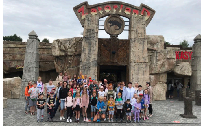
Dinozatorland to pierwszy z wakacyjnych wyjazdów z GOK i GBP

Do końca sierpnia czekamy na wakacyjne zdjęcia oraz własnoręczne wykonane pocztówki z podróży. Prace należy składać w siedzibie biblioteki.